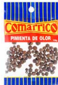
PIMIENTA DE OLOR