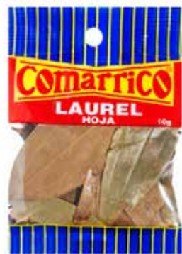
HOJA DE LAUREL